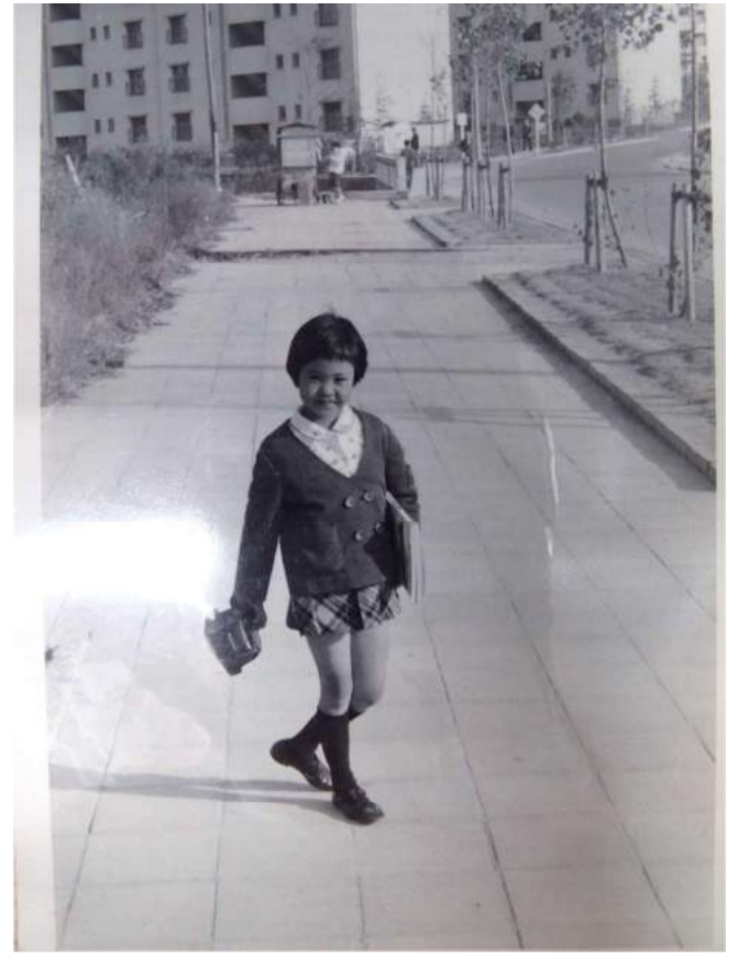
大牟田市内でポーズ