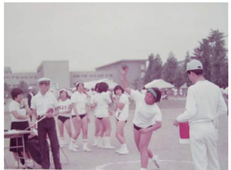
福岡教育大学附属小倉中学校：三附中競技会になぜか砲丸投げでエントリー