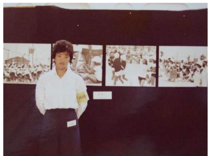
川崎医科大学：学園祭の写真展ブース。自分の作品の前で