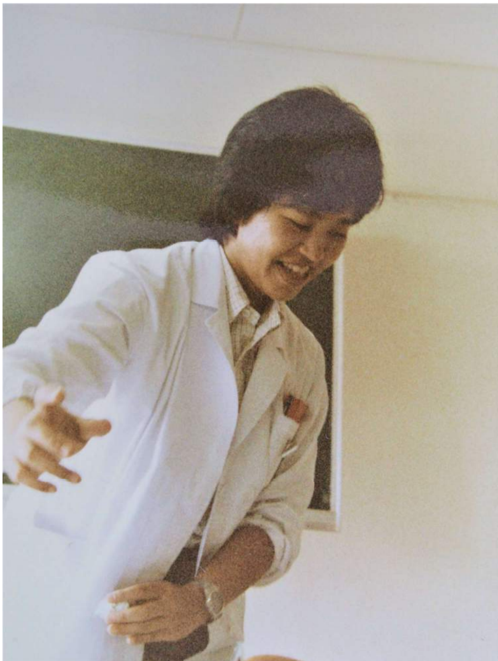
病棟医長から「カルテを書きすぎるから、お前は外科向きじゃない」と言われた小児外科時代