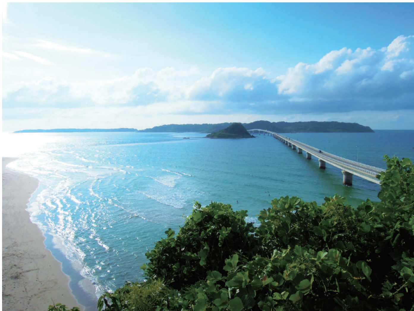
山口県の角島へドライブへ行ったときに撮影しました。