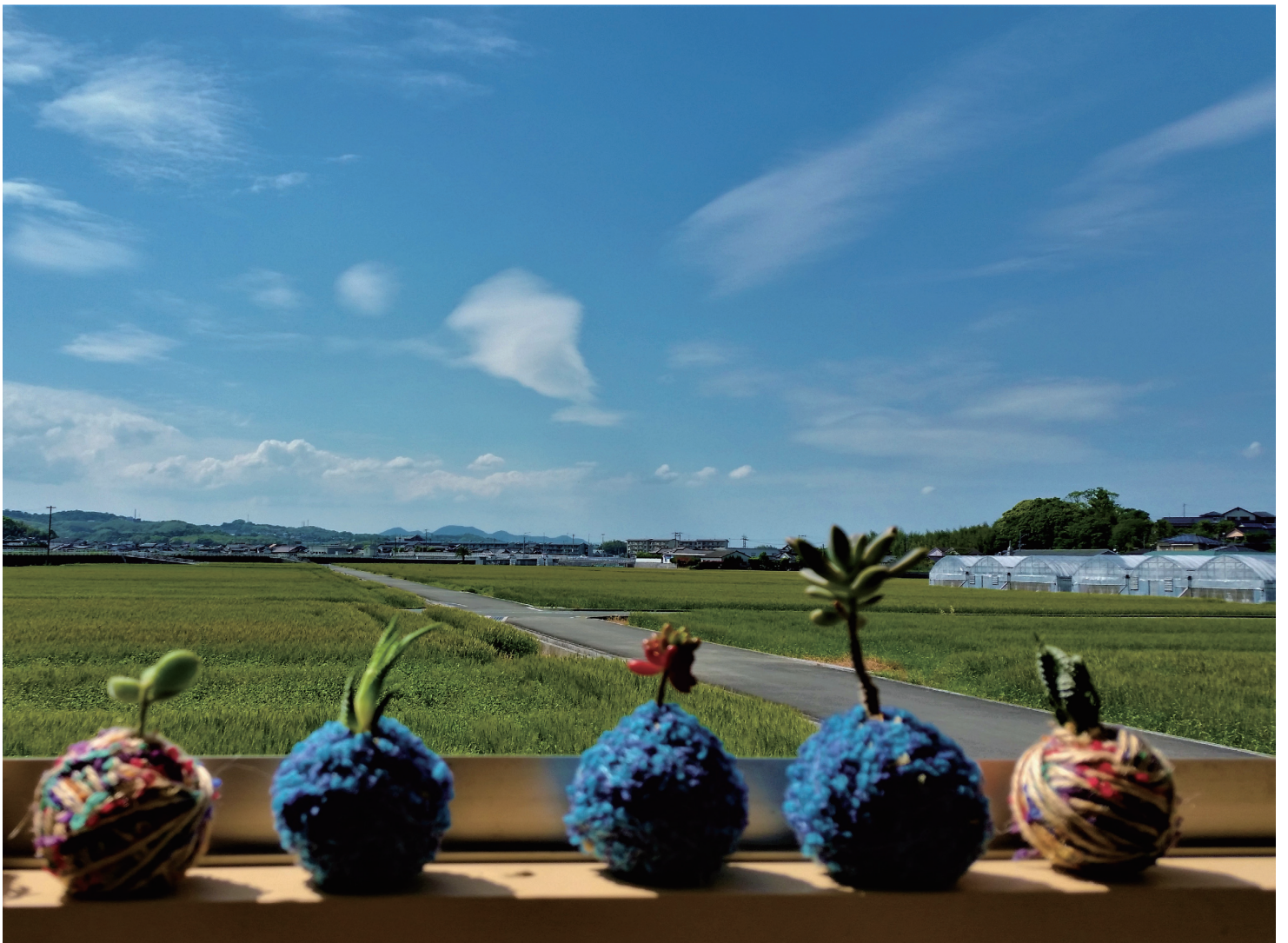
広がる田園風景を背景に大好きな多肉植物を撮影しました。