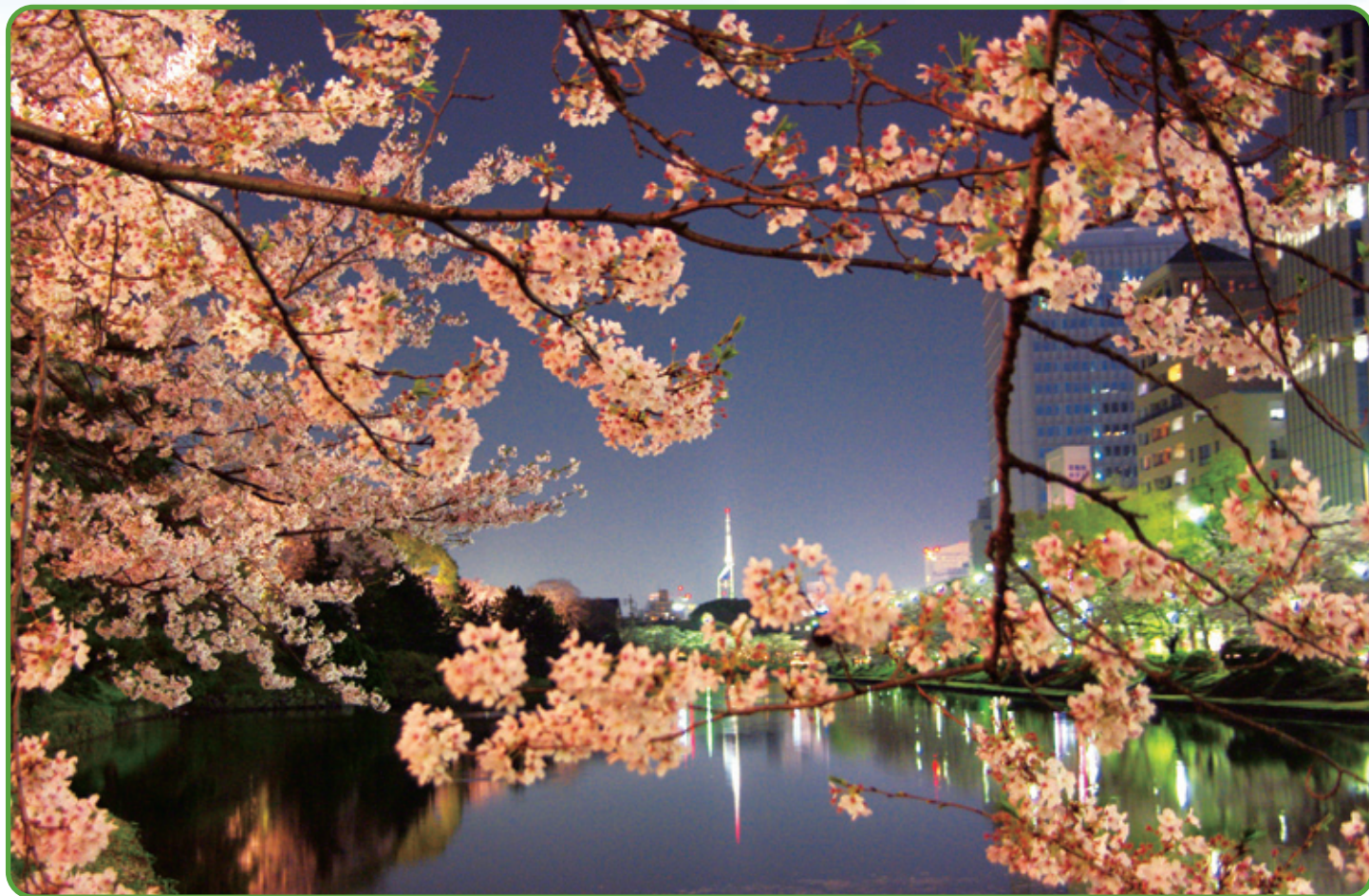
福岡市の舞鶴公園の夜桜です。毎春、舞鶴公園で福岡城さくらまつりが開催され、夕暮れから会場の数カ所でライトアップされます。明治通りに面した城之橋から福岡タワー方向を撮影しています。