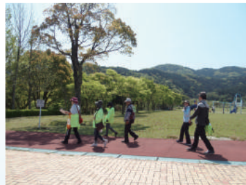
あおぞらの会研修会