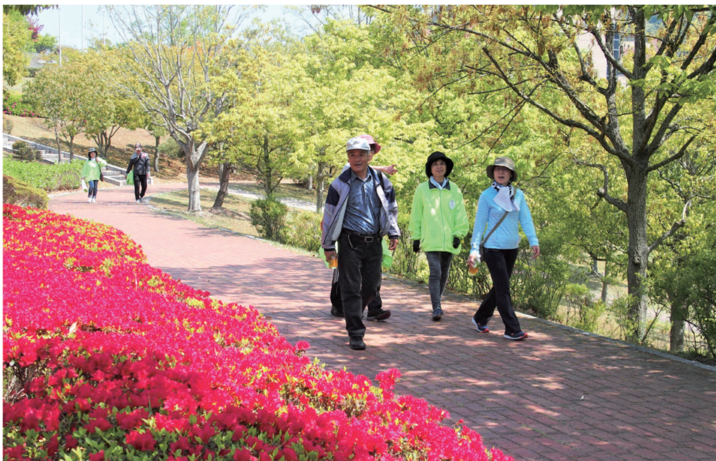
写真：筑豊LCDE合同イベント「筑豊糖尿病ウォークラリー大会」

地域医療支援病院 地域がん診療連携拠点病院 開放型病院 基幹型臨床研修病院（医師） 管理型臨床研修施設（歯科医師） 日本医療機能評価機構認定病院