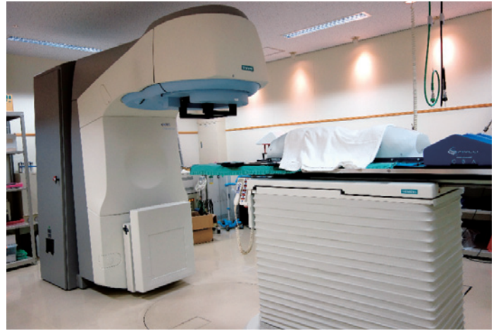
↑リニアック（放射線治療装置）

社会保険田川病院は、平成17年に「地域がん診療連携拠点病院」の指定を受け、平成21年から放射線治療を開始しました。当院で放射線治療を提供することができるようになったことで、田川市郡にお住いの地域住民の皆さまには、住み慣れた場所でより包括的ながん治療を受けていただくことが可能となり、より一層、田川市郡の地域医療に貢献できるものと考えています。当院では、放射線治療専門医をはじめ放射線治療を専門に行うスタッフが年間100症例を超える放射線治療を行っております。