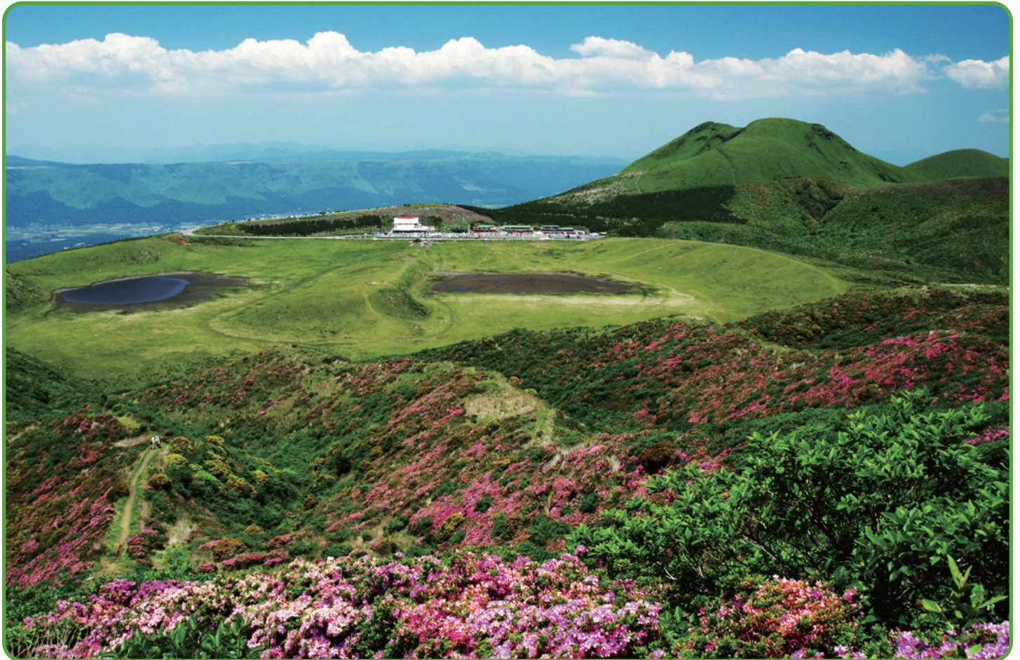
「阿蘇の烏帽子岳」 阿蘇の烏帽子岳中腹より草千里方面を写しています。 山腹のミヤマキリシマと緑の草原のコントラストがきれいです。遠方には外輪山も望めました。