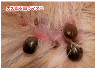
犬の血を吸うマダニ