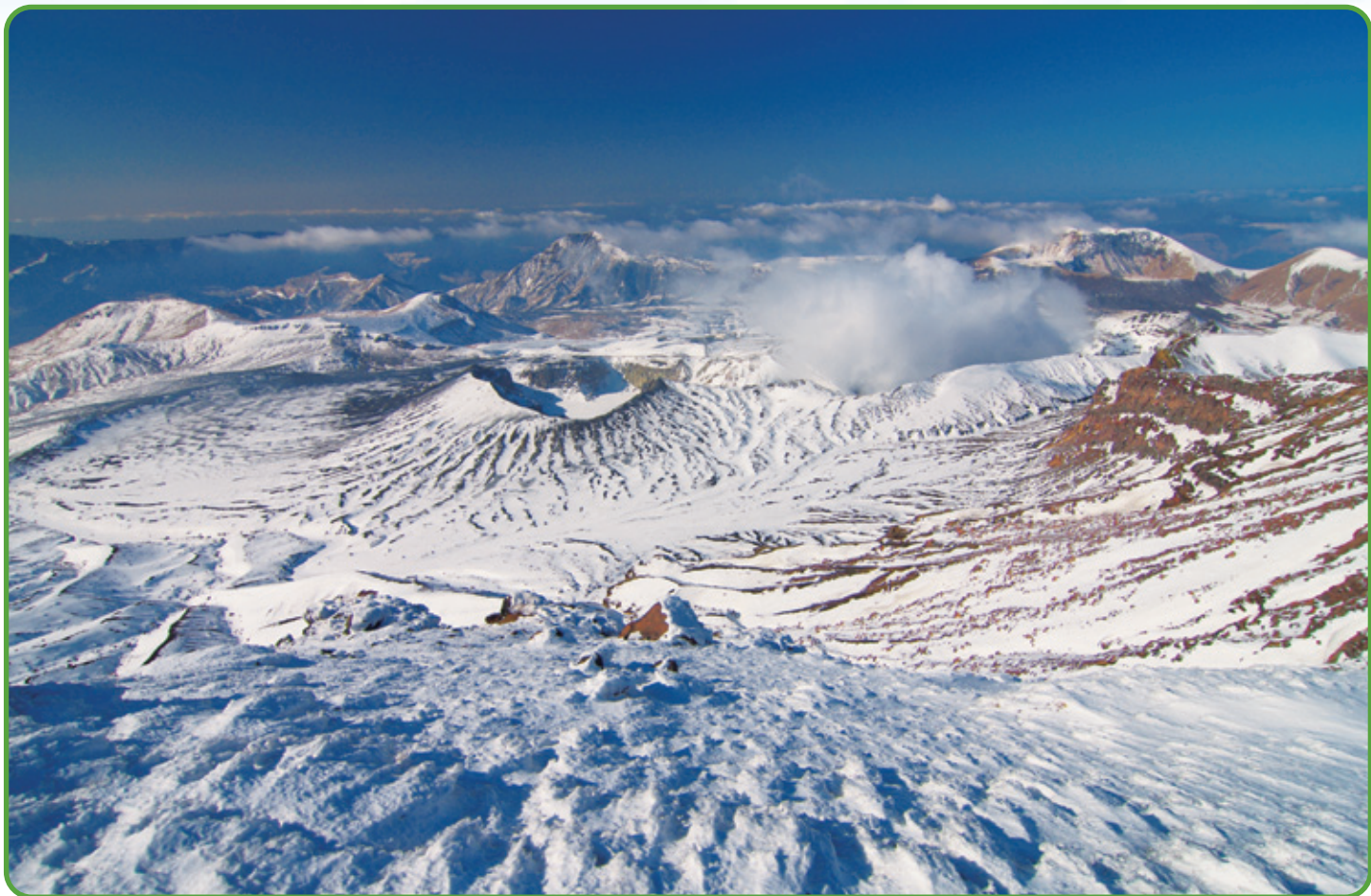
早春に撮影した阿蘇中岳山頂直下の南尾根から火口方面の写真です。噴煙が火口から見られますが、最近の大噴火前の写真です。