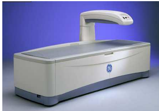
骨密度測定検査を希望される方は、各診療科の担当医にご相談ください。