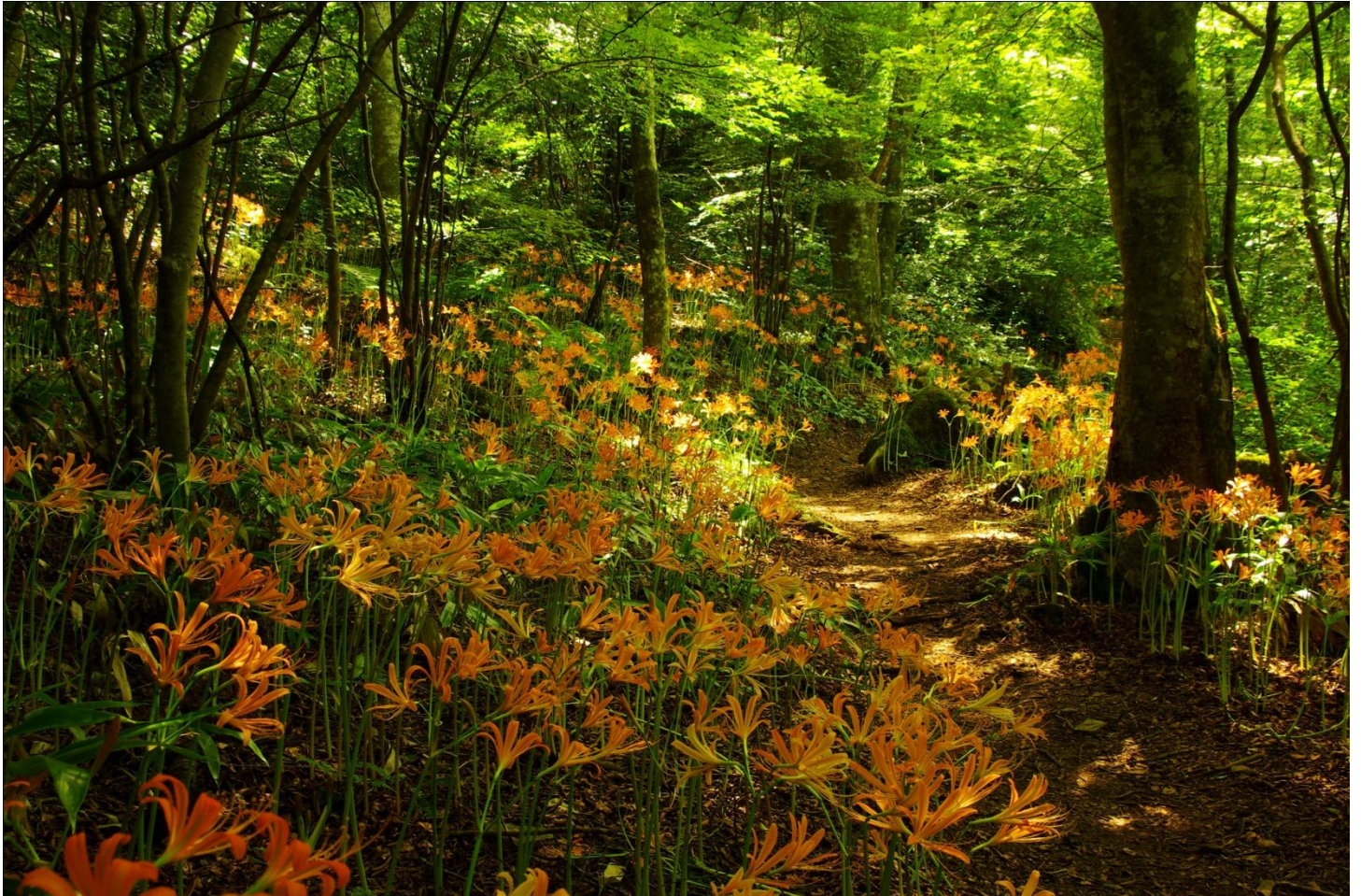
「キツネノカミソリ」