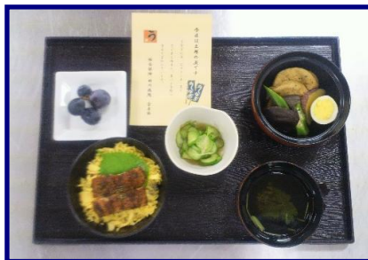
土用の丑（平成24年7月27日）