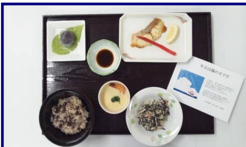
海の日（平成24年7月16日）